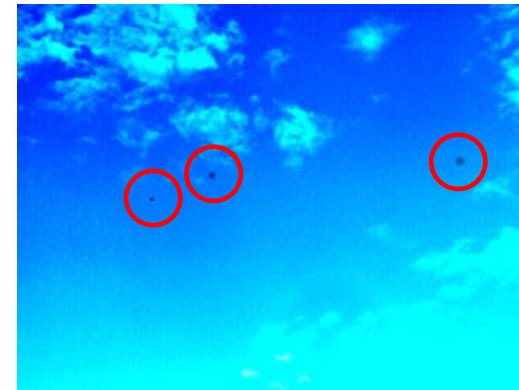
従来のカメラでの塵埃写真