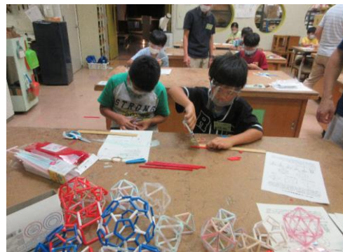
ストロー工作（荒尾）