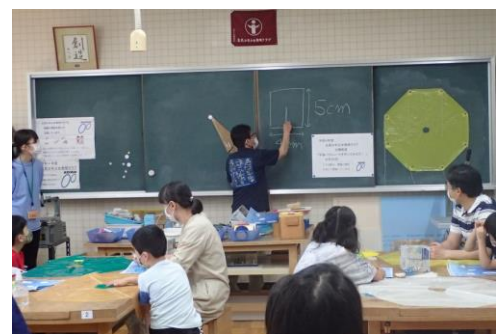
宇宙パラシュートの工作（北見）