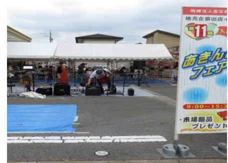
「工作教室」出展（岡崎）