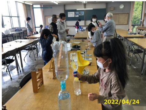
浮沈子の工作（西尾）