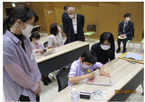
ホバークラフトの工作（三川）