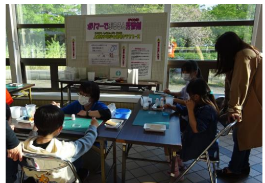
ポリマー芳香剤の工作（上越）