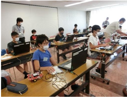
プログラミング研修（北名古屋市）