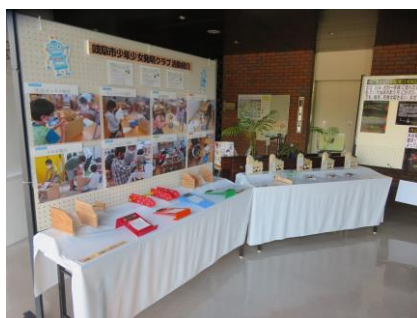
「クラブ作品展」（岐阜）