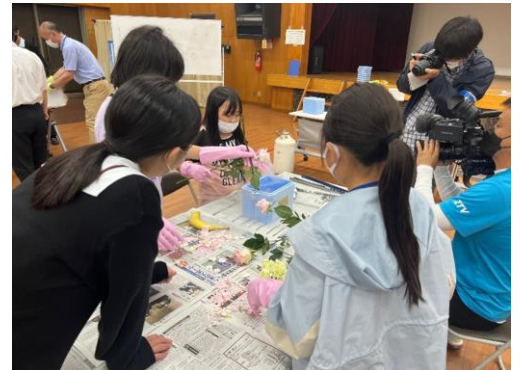
液体窒素による化学実験（新宮）