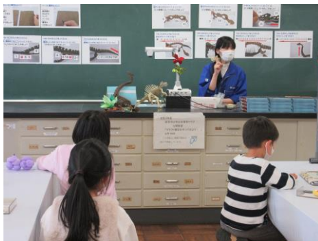
ペーパークラフトの工作（岐阜）