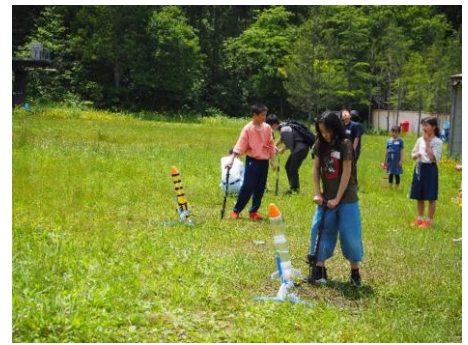
水ロケットの競技会（秋田市）