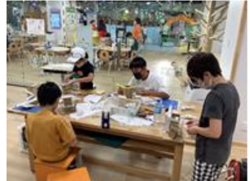
ピタゴラ作品工作（こまき）