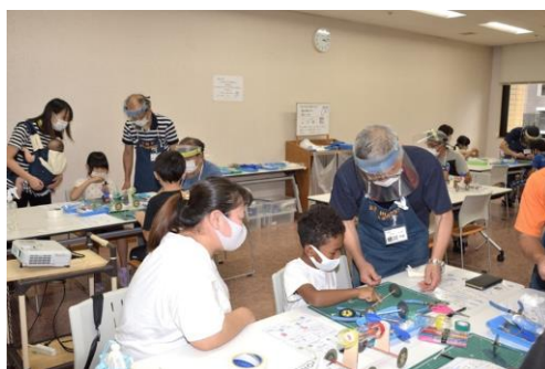
風力カーの工作（半田）