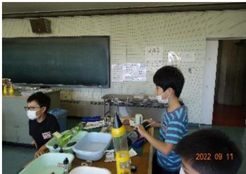
水ロケットの作成（青森市）