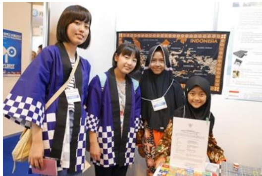
各国の参加者と記念撮影