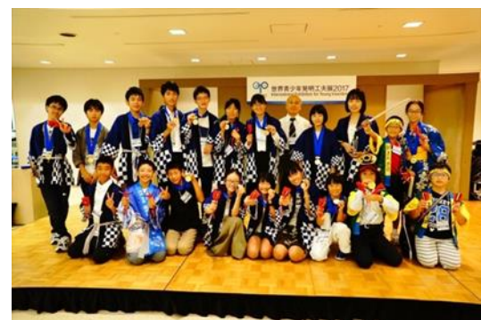
受賞後の集合写真