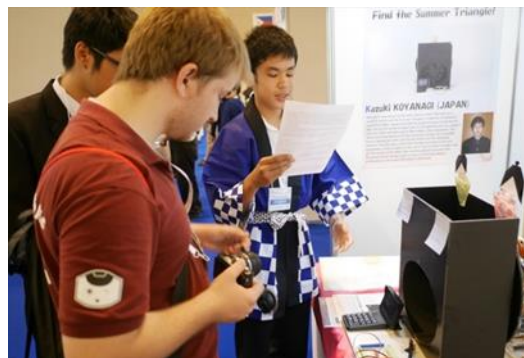
作品を説明する小柳団員