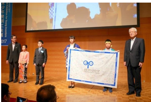
バトンタッチセレモニー