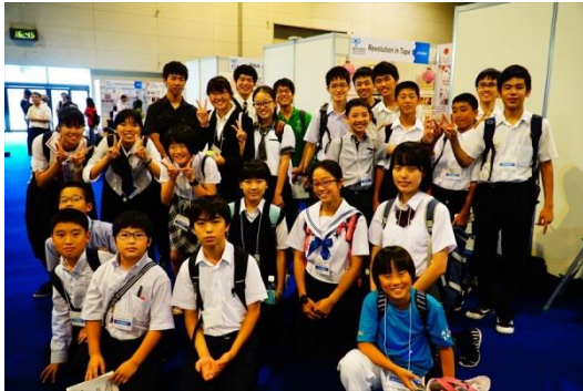
来場した派遣団 OB との記念撮影