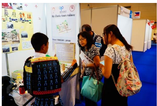
作品を説明する山崎団員