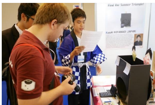
作品を説明する小柳団員