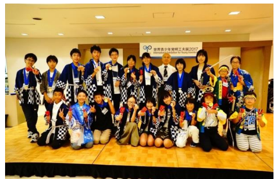
受賞後の記念撮影