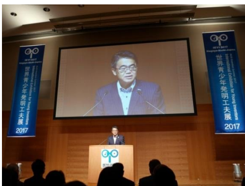
挨拶を述べる大村愛知県知事

展覧会初日となる 7 月 27 日には、主催の野間口発明協会会長、共催の大村愛知県知事、河村名古屋市長、石丸愛知県発明協会会長出席のもと、開会式が挙行された。同日 10 時より開場となった展示会場には 15 か国・地域から出品された 159 作品が展示された。