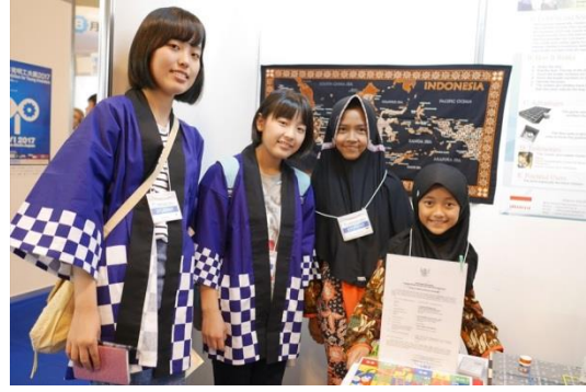
各国の参加者と記念撮影