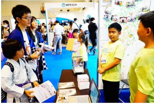
各国ブースを見学する日本団員